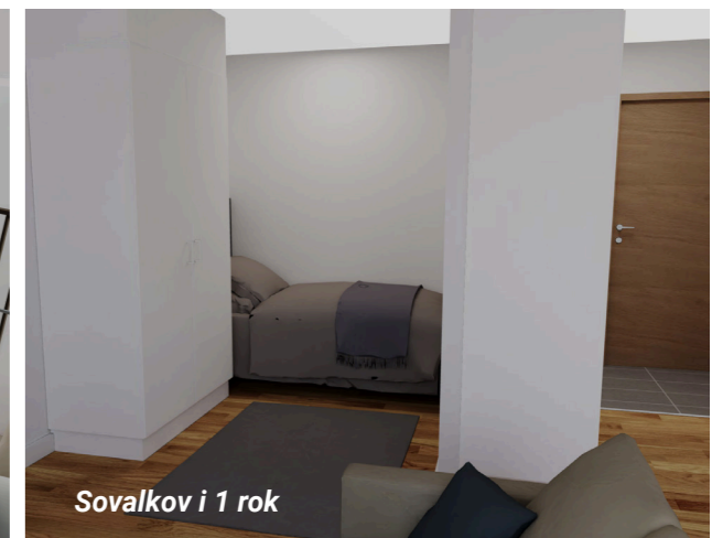
Sovalkov i 1 rok