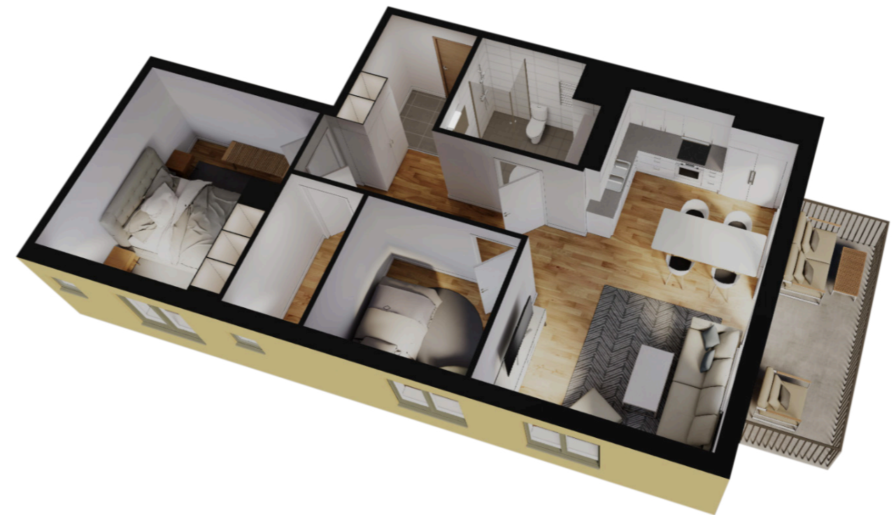
1 RoK med balkong