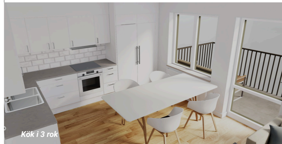
Kök i 3 rok